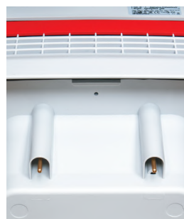
Capteurs d'eau sous le moteur