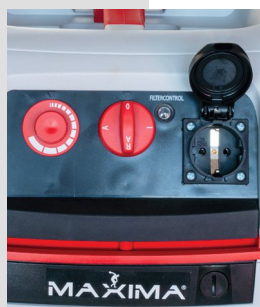
Façade avec commandes