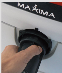
Branchement tuyau rapide