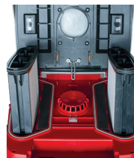
Paire de filtres en polyester lavable