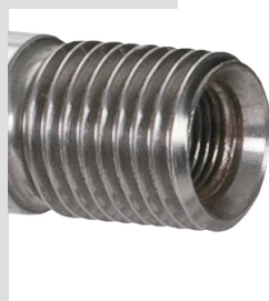
Connecteur 1" 1/4 et 1/2 gaz