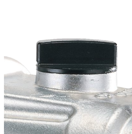
3 vitesses réglables