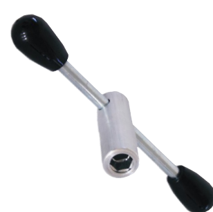
Treuil / Clé anglaise