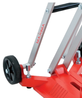
Double barre de stabilisation