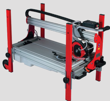
Facile à transporter