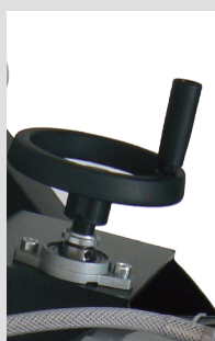
Réglage de la hauteur de coupe