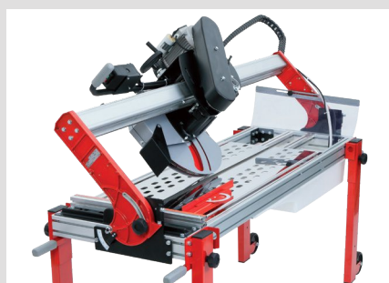
Inclinable à 45° et glissement précis et fluide