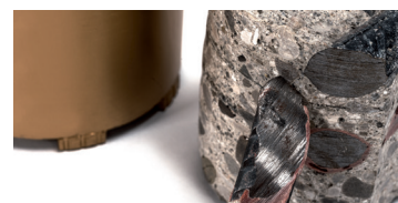
Idéal pour percer le béton armé à sec