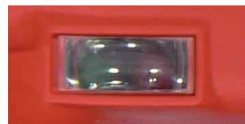
Led de surcharge