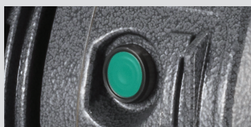
Bouton activation de la micropercussion