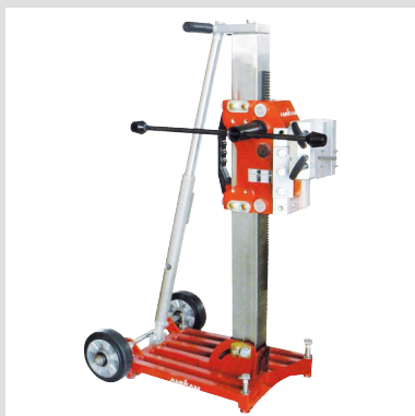
Colonne entièrement en acier