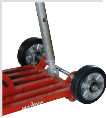
Roues pour un transport facile