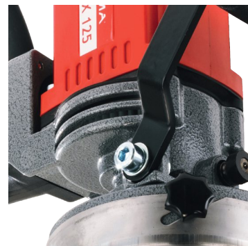
Embrayage électronique et mécanique