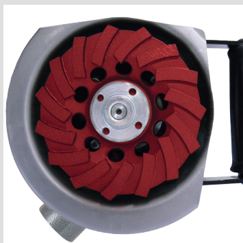
Utilisation dans les angles