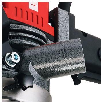
Entrée par aspiration Ø 36