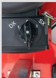
Interrupteur avec inverseur de direction