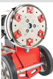
Plateau robuste jusqu'à 6 modules