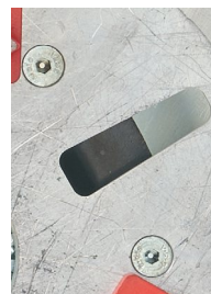
Fixation rapide des modules