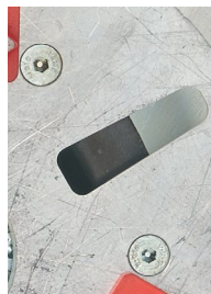
Fixation rapide des modules