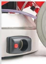
Bouche pour aspirateur à fil plancher