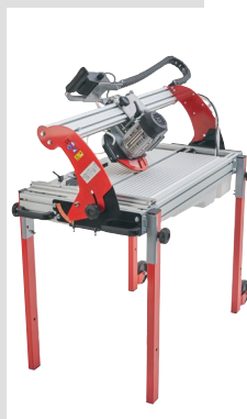
Inclinable à 45°