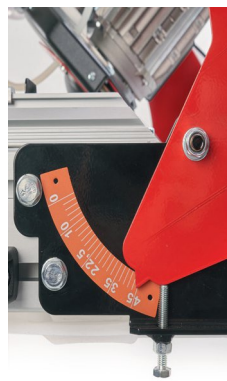
Indicateur d'inclinaison à 45°