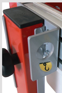
Facile à transporter