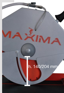
Hauteur de coupe de 140 à 204 mm