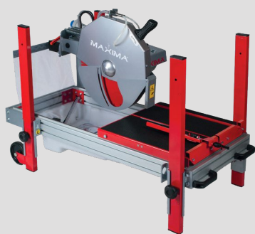
Facile à déplacer