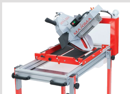
Inclinable à 45° et glissement précis et fluide