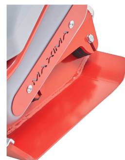
Plaque en acier incrémentée de manganèse laminée à chaud façonnée et garantie 6 ans