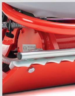
Barre de protection et moletage par égouttement