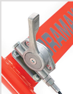
Levier d'accélérateur avec verrouillage en point mort