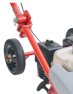
Roues à pas larges et intégrées