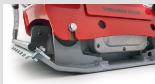
Plaque en acier modelé