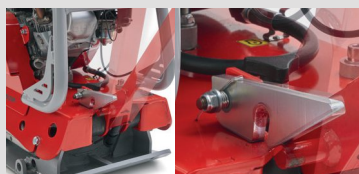
Arrêt pour lever/abaisser le guidon