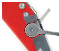
Réglage de la vitesse