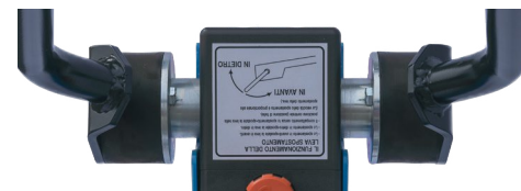
Caoutchoucs anti-vibrations au guidon