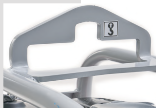
Crochet de levage