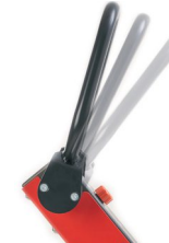
Levier de déplacement avant / arrière