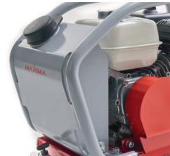
Réservoir d'eau inclus dans le réservoir