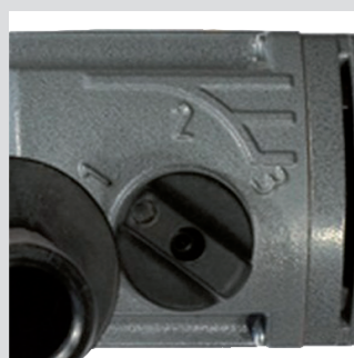
Selettore tre velocità