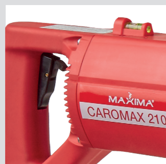
Interruttore con blocca tasto