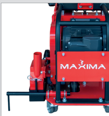
Distanziale per fresature parallele