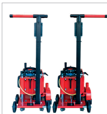
Impugnatura regolabile per filo-parete